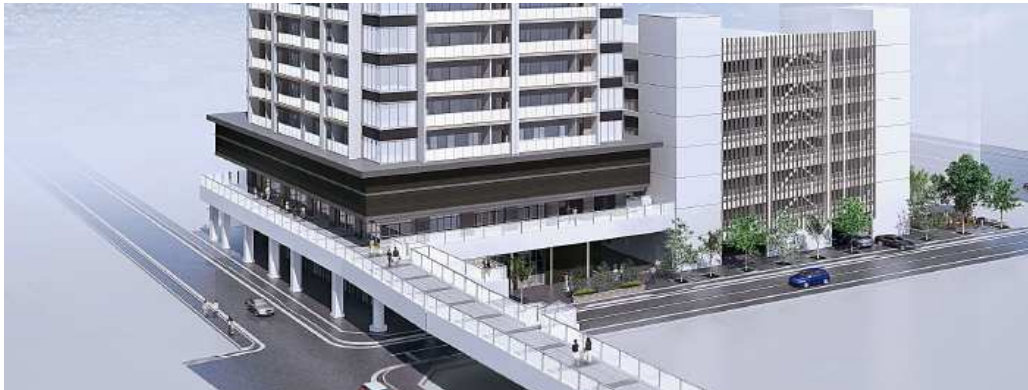
本マンションと駐車場棟の2階に、高崎駅へとつながるペDESTリアンデッキが接続